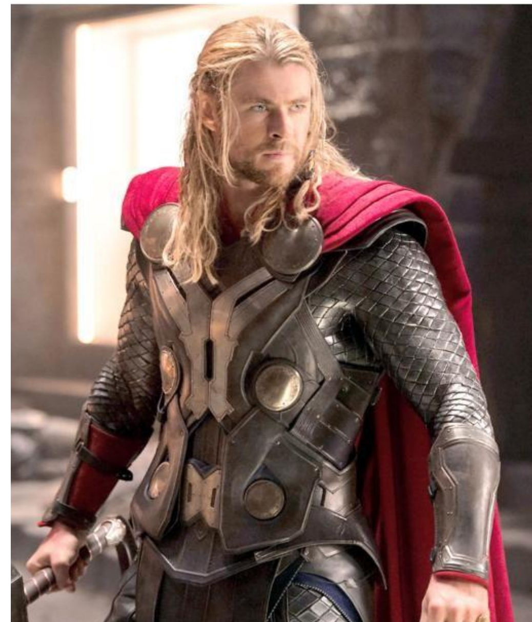
Крис Хемсворт для роли Тора за полгода набрал 18 кг мышечной массы