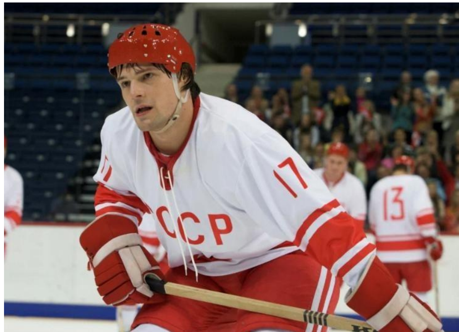
Данила Козловский для роли Валерия Харламова в знаменитой «Легенде 17» несколько месяцев учился с профессиональными тренерами кататься на коньках и владеть хоккейной шайбой